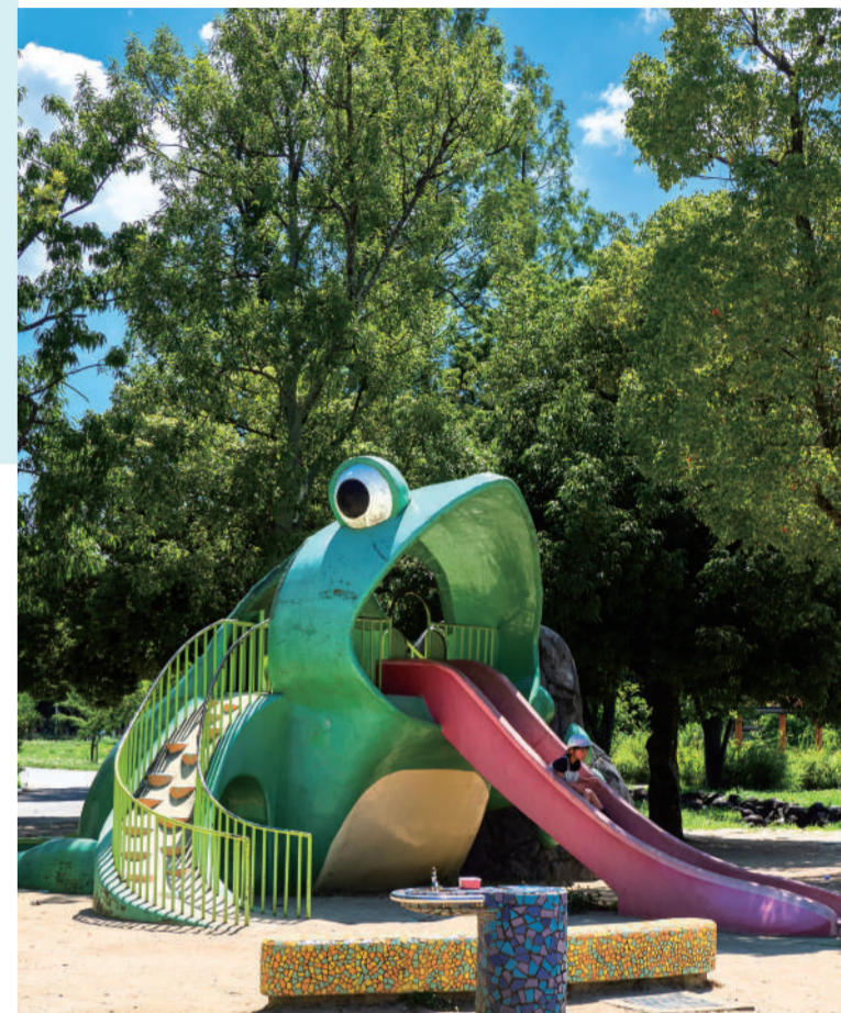
北地区 まいまい広場付近